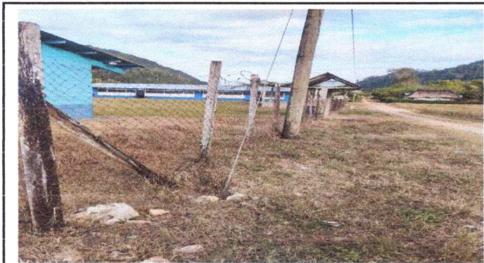
Foto1: Se observa las mallas en mal estado