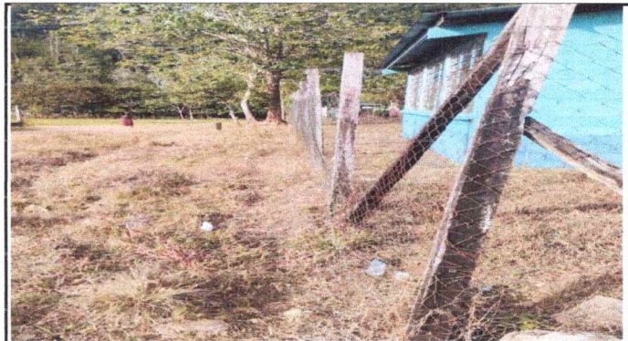
Foto 2: Se observa los postes de las mallas casi por caer se necesita reparacion